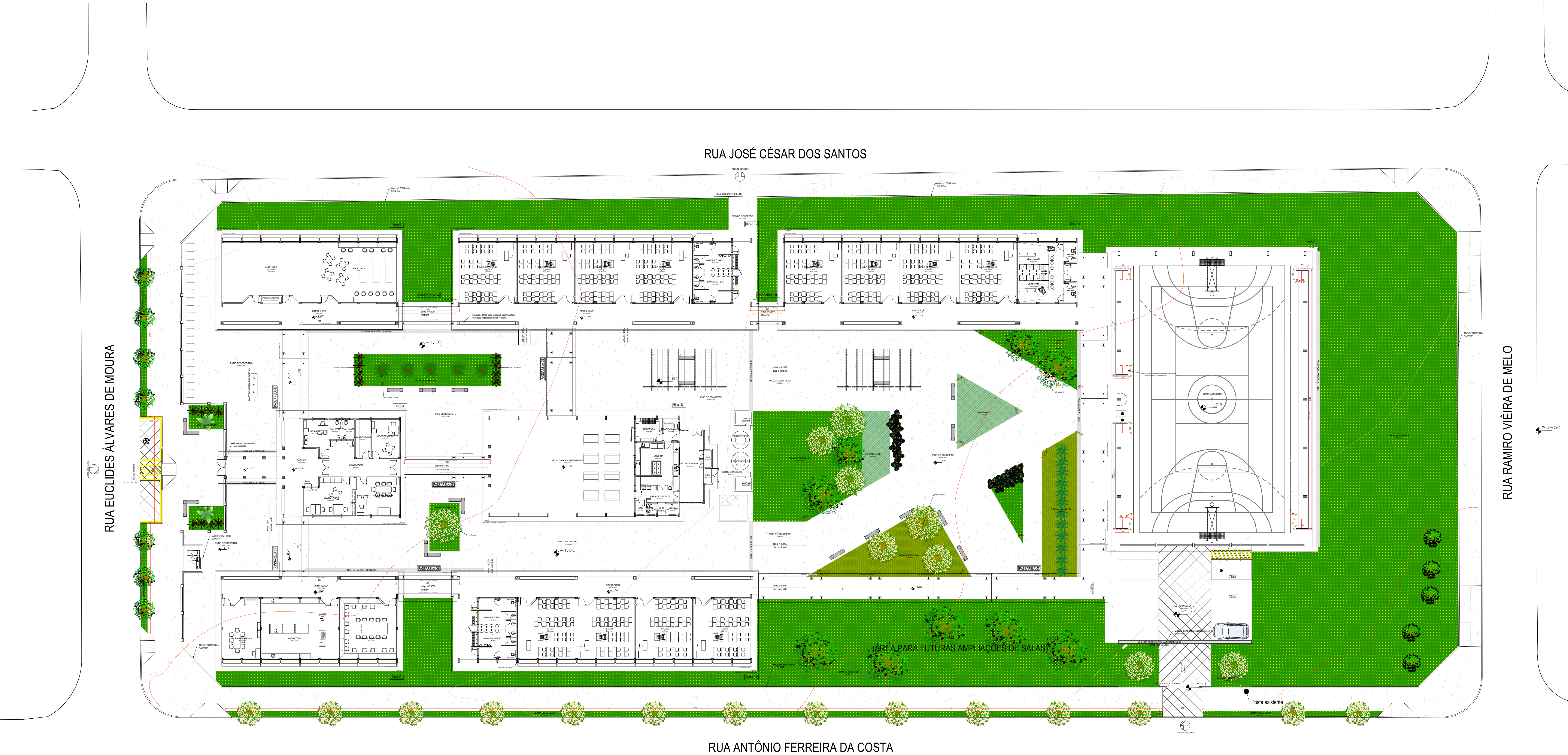
FACHADA LATERAL ESC. 1:150